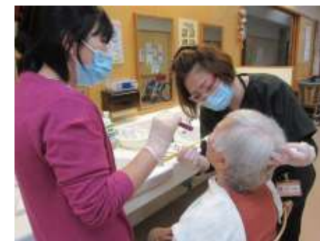
温身の郷の管理栄養士とともに介護、看護職に技術指導を行い口腔状態の改善を目指す