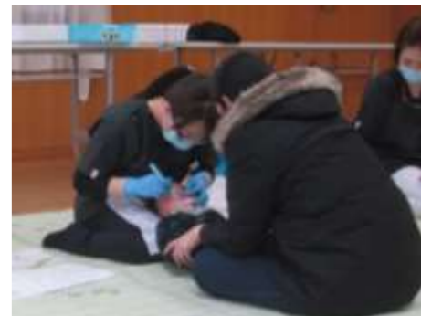
1歳6カ月児健診で実際に仕上げ磨きをする歯科衛生士