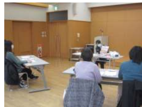
歯科衛生士による両親学級での指導の様子